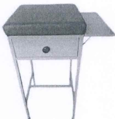
Especificación Técnica – Mesa Porta Balanza Clínica