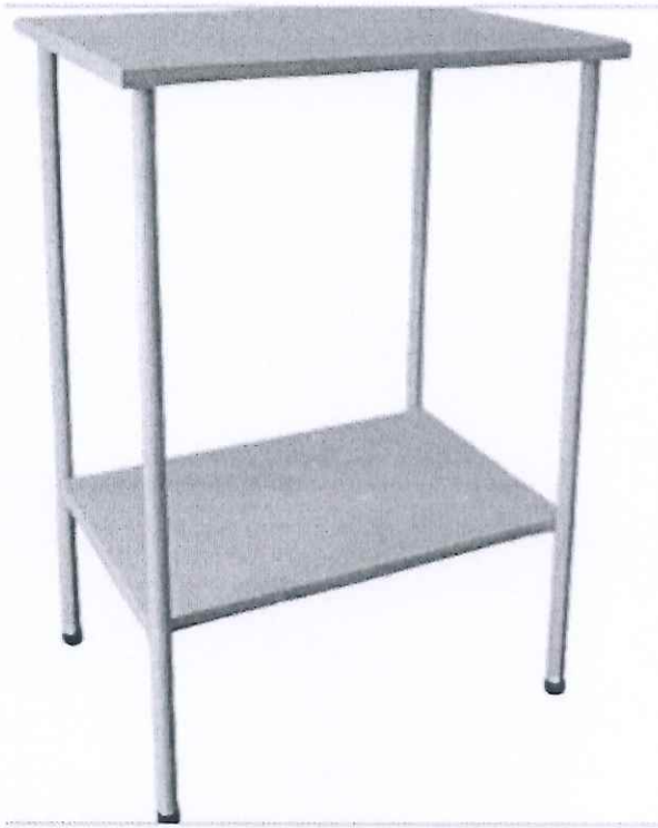
Especificación Técnica – Mesa Mayo Clínica